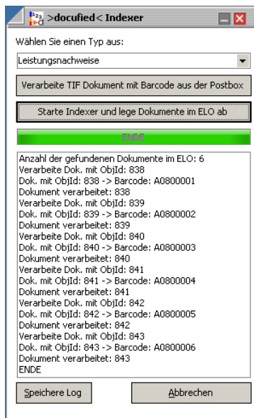
Abb. links: Verarbeitung je Belegtyp